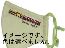
イメージです。色は選べません。