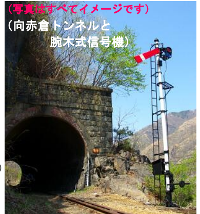
(写真はすべてイメージです) (向赤倉トンネルと腕木式信号機)

桐生駅——相老駅——大間々駅——通洞駅……足尾銅山観光(見学)……銅山観光前～～ 6:36発 6:43発 6:58発 8:00着 8:15～9:00頃 9:05発 ～～～下間藤停留所(松木街道踏切)……………第二松木川橋梁……………向間藤トンネル…………… 9:15着 ……向赤倉トンネル……出川橋梁手前……………(一般道)……………古河橋……………(一般道)……間藤駅=== 旧足尾本山駅には立ち寄りません 11:00頃 11:31発 =====(トロッコわっしー2号)===== トロッコ席利用・車内で自由昼食(各自持参) 12:54着 13:05着 13:18着