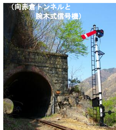
(向赤倉トンネルと腕木式信号機)