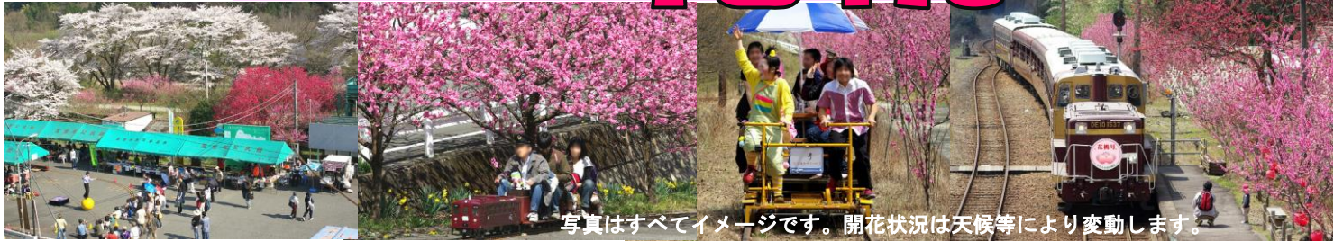
写真はすべてイメージです。開花状況は天候等により変動します。