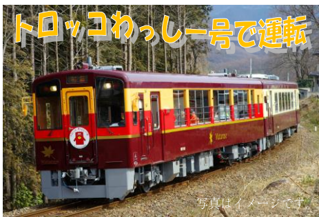
写真はイメージです。トロッコ車両は窓にガラスを取り付けて運行。暖房も完備しています。