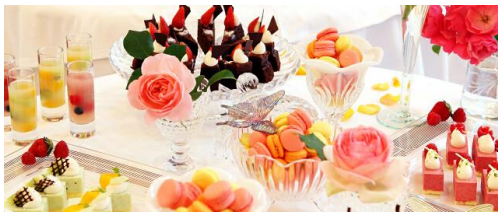
写真はイメージです。実際の料理内容とは異なる場合があります。