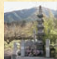
せきぞうごじゆうのとう 石造五重塔