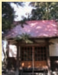
いなり 稲荷神社 江戸時代に活躍した地元彫刻師による社殿彫刻(寛政3年(1791)製作)が保存されている。