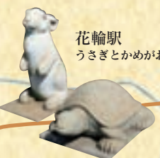
花輪駅 うさぎとかめがお出迎え