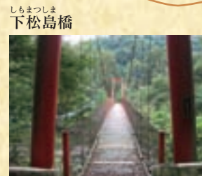
しもまつしま 下松島橋