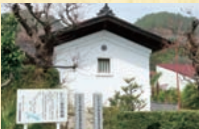
ごようどうぐら 御用銅蔵 足尾町で精錬され、江戸に運ぶための御用銅を一時保管するために使われていた。かつて銅(あかがね)街道として繁栄した宿場の名残をとどめている。みどり市指定重要文化財