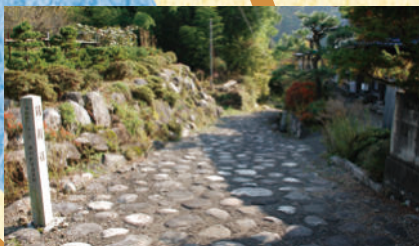
街道に整備した石畳 かつて足尾銅山から江戸へ銅を運ぶために使われた銅（あかかね）街道。（近年復元）