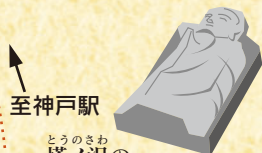
至神戸駅 至塔ノ沢の石造 沢入駅より約7km 徒歩2時間30分