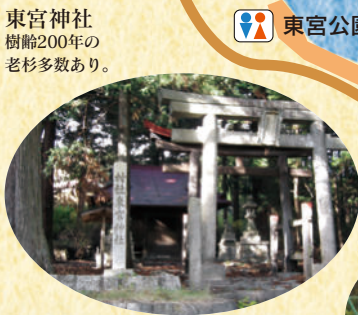
東宮神社 樹齢200年の老杉多数あり。