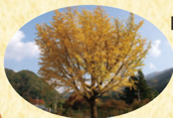
旧沢入小学校の いちよう