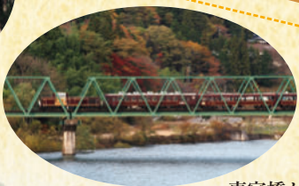
東宮橋から観るわ鉄