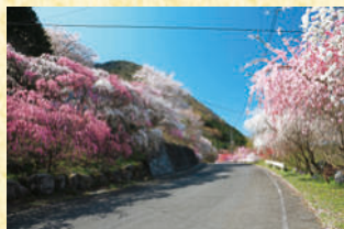
小夜戸・大畑の花桃街道 (4月中旬頃)