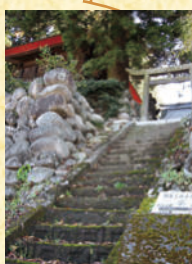
とよさと豊郷神社