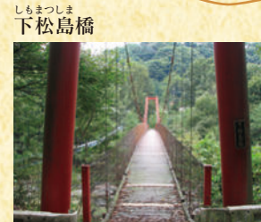
しもまつしま 下松島橋