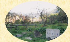
いなり稲荷神社 江戸時代に活躍した地元彫刻師による社殿彫刻(寛政3年(1791)製作)が保存されている。