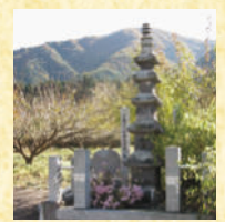
せきざうこじゆうのとう 石造五重塔