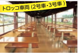
トロッコ車両 (2号車・3号車)

深谷3号の大間々駅発車時に車内で販売します。数に限りがありますので、確実にお買い求めになりたい方は前日までに電話でご予約ください。 レストラン清流 TEL.0277-97-3681