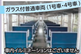
ガラス付普通車両 (1号車・4号車)