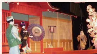
桐生からくり人形芝居（有鄰館内）