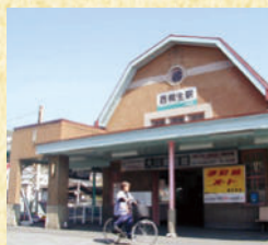
西桐生駅 国の登録有形文化財であり、関東の駅百選にも選ばれている。