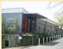
大川美術館 松本竣介、野田英夫を中心とした日本近・現代の画家の作品とピカソ、ベン・シャーン等海外の画家の作品を展示。