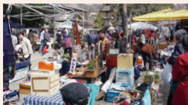
こみん ぐ こつとういち 天満宮古具骨董市（桐生天満宮）