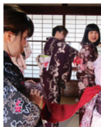
桐生おりひめ倶楽部 （山本きもの学院）