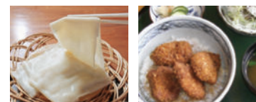
お腹がすいたら、桐生名物「ソースカツ丼」や幅広いうどん「ひもかわ」はいかがですか？ 地図掲載店舗の他、市内には多数のお店がありますので、食べ歩いてみてください。