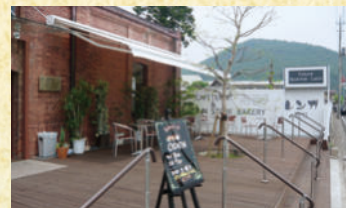
ベーカリーカフェ・レンガ レンガ造りのノコギリ屋根工場で、焼きたてのパンやお茶を楽しめる。

※JR桐生駅構内など、市内には全7箇所の無料レンタサイクルステーションがあります。