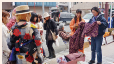
らくいち 桐生楽市（本町三丁目）