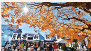
かいば さ やいち 買場紗綾市（東久方町二丁目）