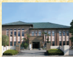
桐生織物記念館 織物や織機の展示のほか、産地価格での織物製品の販売を行っている。