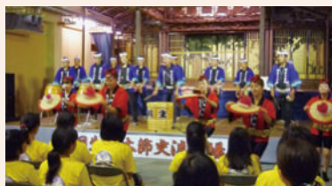
桐生八木節交流広場（あーとほーる 鉦座）