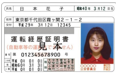
運転経歴証明書(見本)

わたらせ渓谷鐵道株式会社 みどり市大間々町大間々1603-1 電話：0277-73-2110