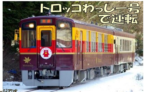
写真はイメージです。トロッコ車両は窓にガラスを取り付けて運行。暖房も完備しています。