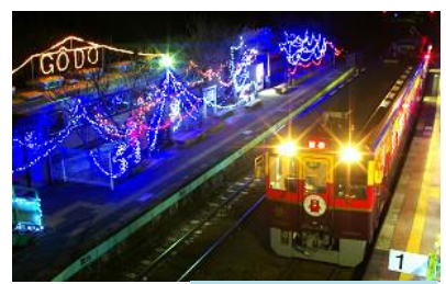
わたらせ渓谷鐵道各駅イルミネーションの様子。写真はイメージです。