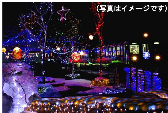
わたらせ渓谷鐵道フォトコンテスト 2012 入賞作品

未就学児 1,000円 (弁当・ジュース・わっしークリアファイル・わっしーステッカー2枚代金を含む)