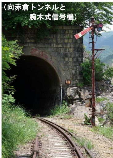
(向赤倉トンネルと腕木式信号機)